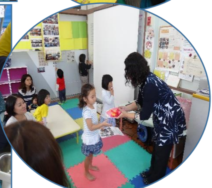
ひだまり修子式 園長先生から修了証授与