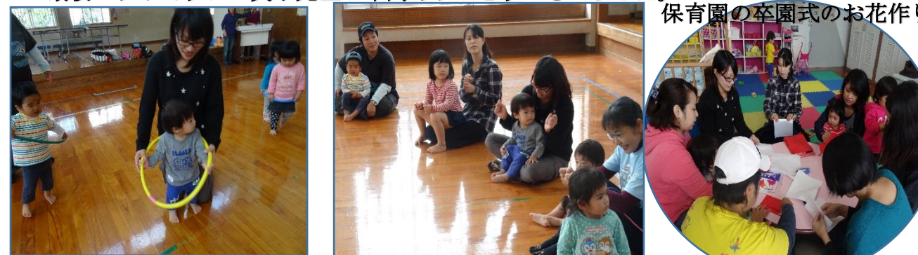
保育園の卒園式のお花作り