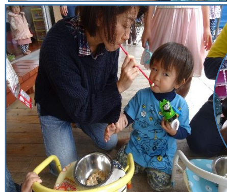
▲卵ポーロをストローで吸ってお口へ