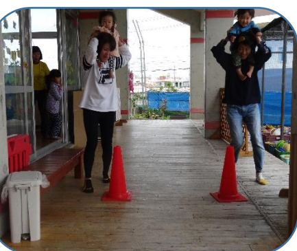
▲お別れ会ゲームで頑張るママたち